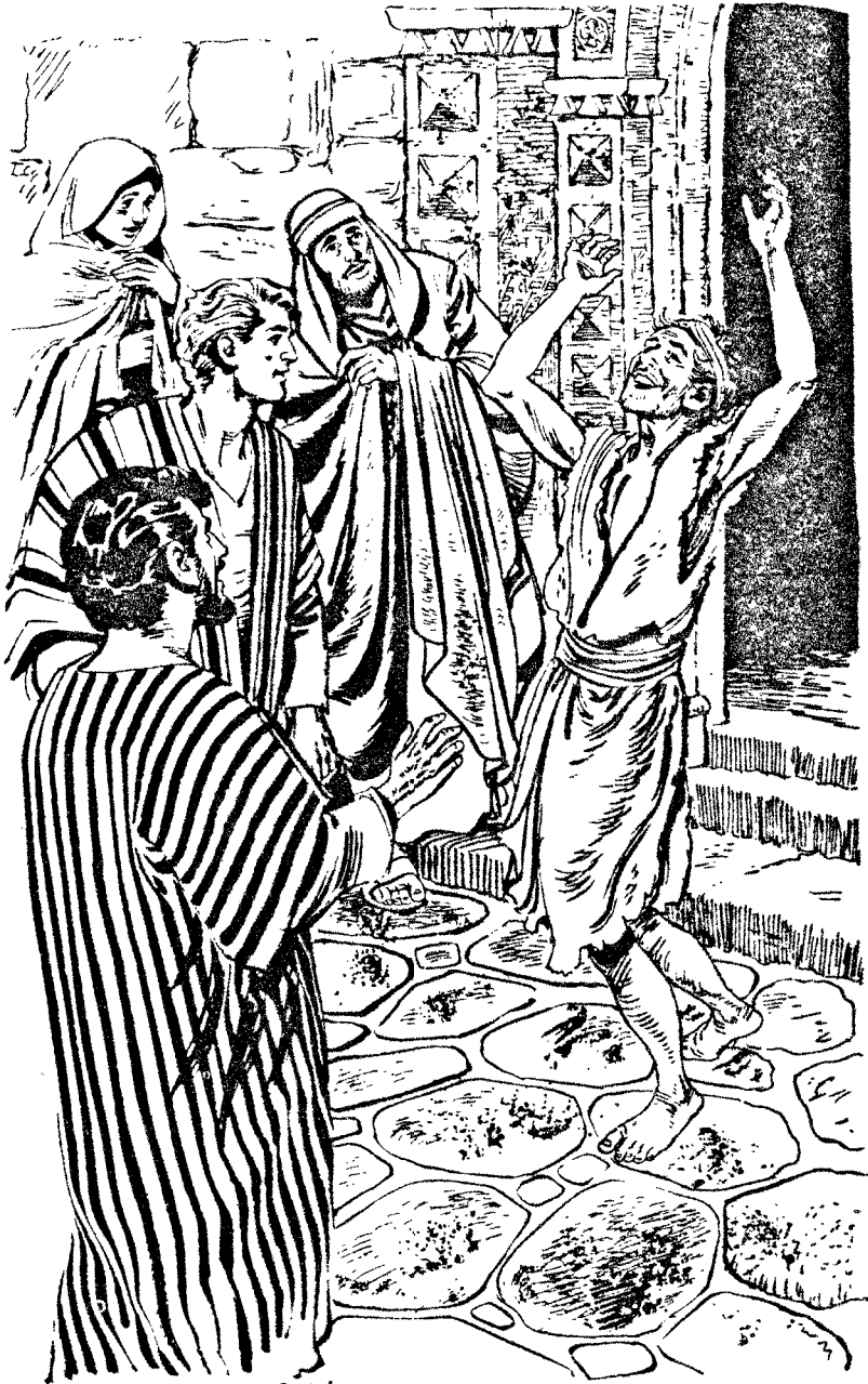
D C Cook Foundation