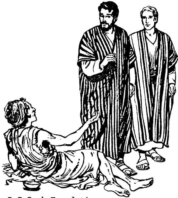
D C Cook Foundation