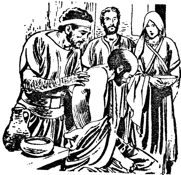
D C Cook Foundation