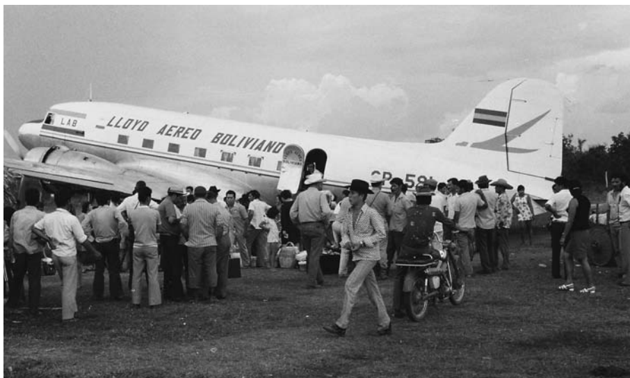
Figura 1 – Aeropuerto de Riberalta cerca de la base del ILV en Tumi Chucua, 1973

En 1963, en un artículo que se hizo famoso, Marshall Sahlins identificaba las figuras del poder en Melanesia con la letanía: Poor man, rich man, big-man, chief (Sahlins, 1963). Unos pocos años antes, en 1955, el misionero norteamericano Gilbert Prost aterrizaba en hidroavión sobre el río Benecito, en medio de la Amazonía boliviana. Mandado por el ILV (Instituto Lingüístico de Verano), establecido en la base de Tumi Chucua, en las cercanías de Riberalta había venido obviamente para evangelizar a los chacobo (fig. 1). Sin embargo, su proyecto de injerencia religiosa tuvo también repercusiones sobre la organización económica, territorial y social de este grupo de idioma pano. Llegó hasta tener impacto, como lo demostré en otra ocasión, sobre sus creencias escatológicas, incluido el lugar postulado como última residencia de los muertos (Erikson, 2018).