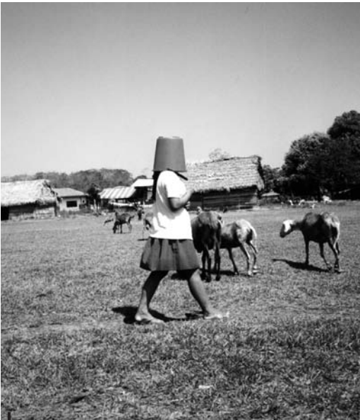
Figura 2 – Ovejas en Alto Ivón, 2010

[...] if counting to seven and knowledge of the seven-day week cycle are necessary for our sanctification, then why did Jesus not make this clear when he commanded us to make disciples of all nations? Why did he, the Son of God, not say something like: “Now for you who are going to nations which can only count to one and have no knowledge of the seven-day week cycle, be sure to teach these “nations” how to count to seven as well as the days of the week otherwise they cannot become my disciples?” I think that is a fair question to ask from someone like me who went to such a people